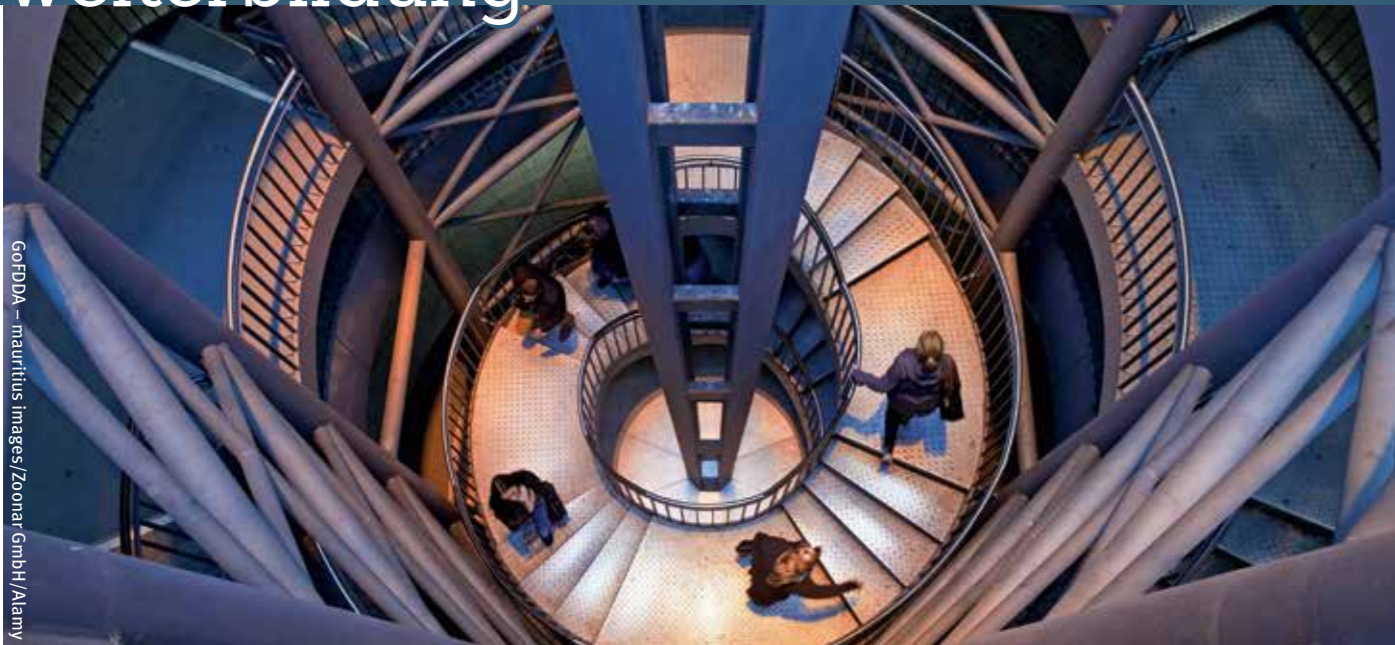
GoFDDA – mauritius Images/Zoonar GmbH/Alamy