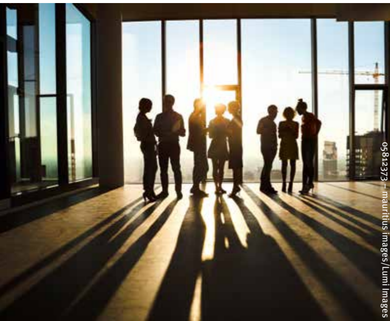
05812373 – mauritius Images/Lumi Images

Begonnen hat alles 1970 in Berlin mit einer Interessenvertretung für deutsche Pressebildagenturen und Bildarchive. Heute hat sich daraus die wichtigste Instanz für alle Fragen rund um visuelle Inhalte entwickelt. Ein Verband, der die kleinen und großen Interessen aller Bildanbieter speziell in Deutschland, aber auch in ganz Europa vertritt. Wir repräsentieren das gesamte Spektrum des Bild- und Filmangebots aus Nachrichten, Prominenz, Geschichte, Kunst und Stock. Zu uns gehören außerdem auch Unternehmen, die agenturnahe Services anbieten, bspw. Rechteverfolgung, Keywording und Digital-Asset-Management.