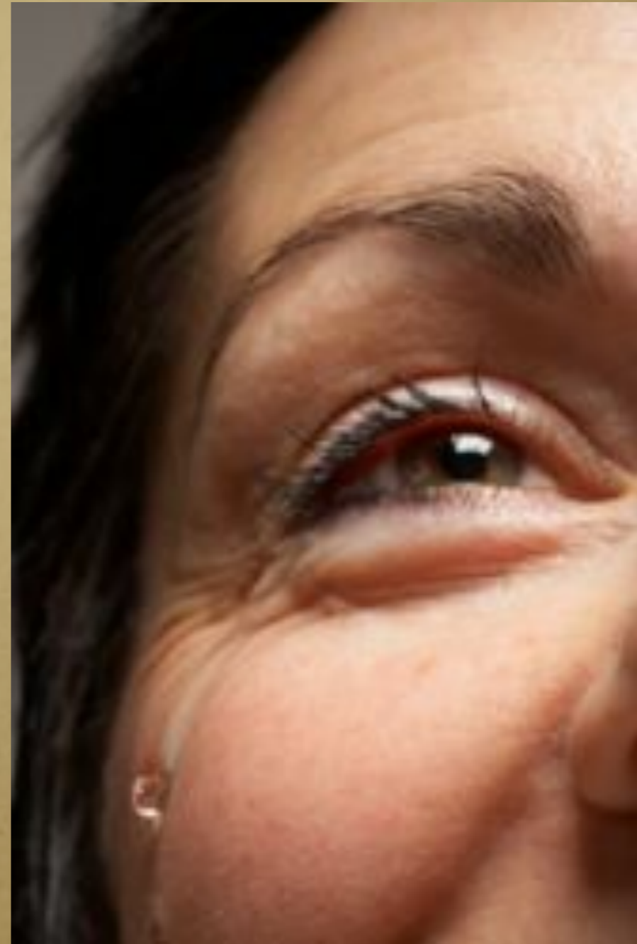
Glück und Glücksträhne