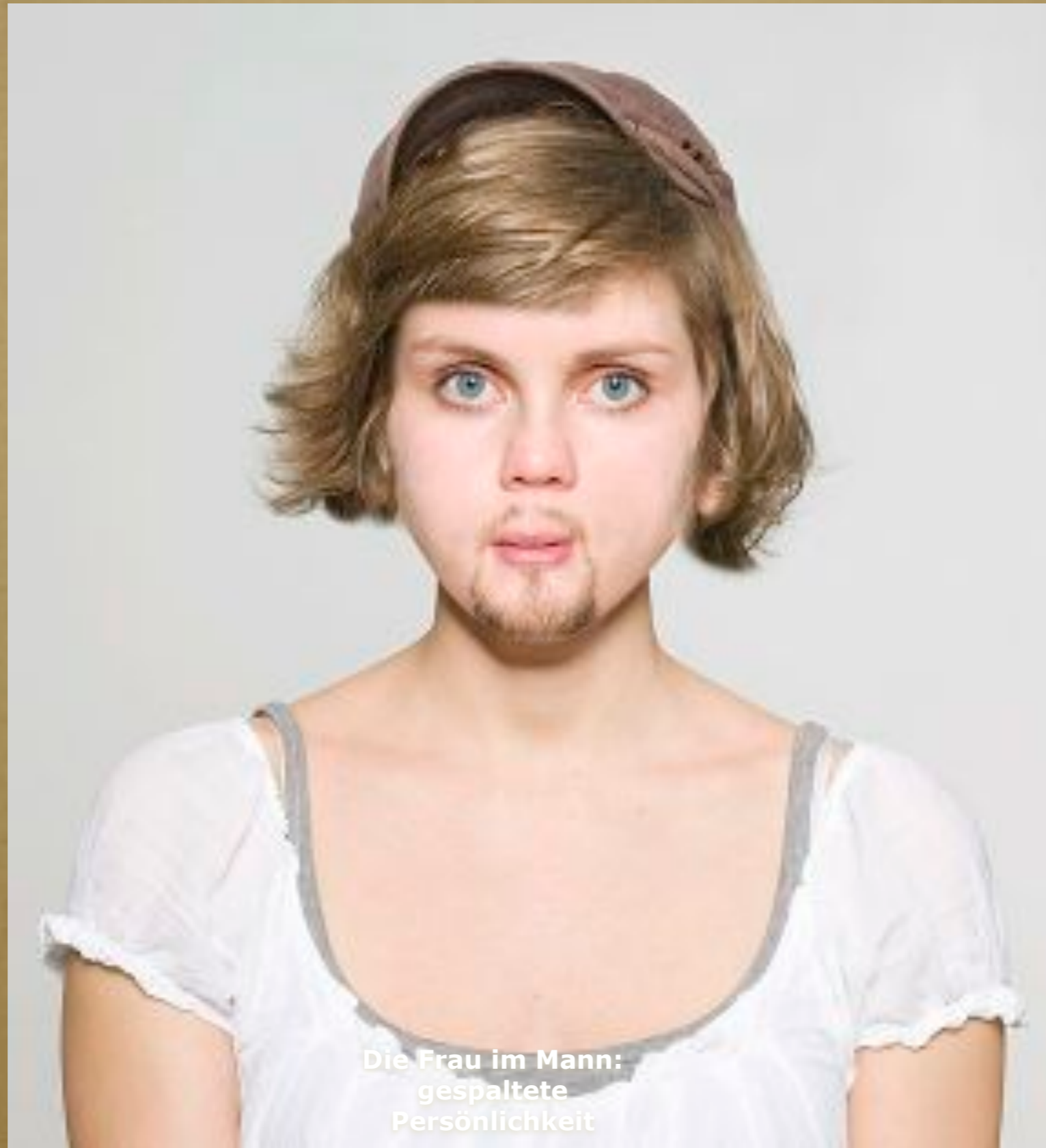
Die Frau im Mann: gespaltete Persönlichkeit